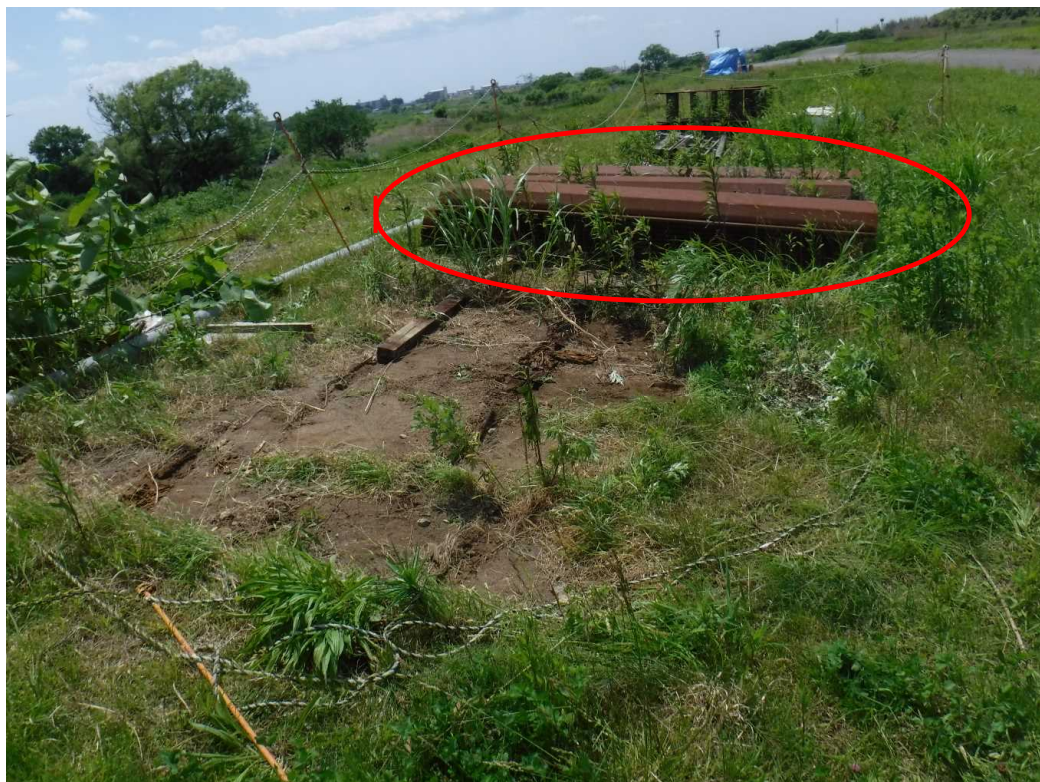
盗難された鋼矢板(6月5日撮影)