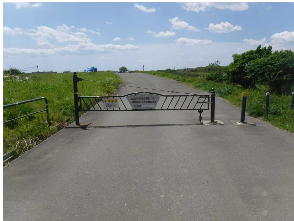
車両進入禁止ゲート(6月5日撮影)