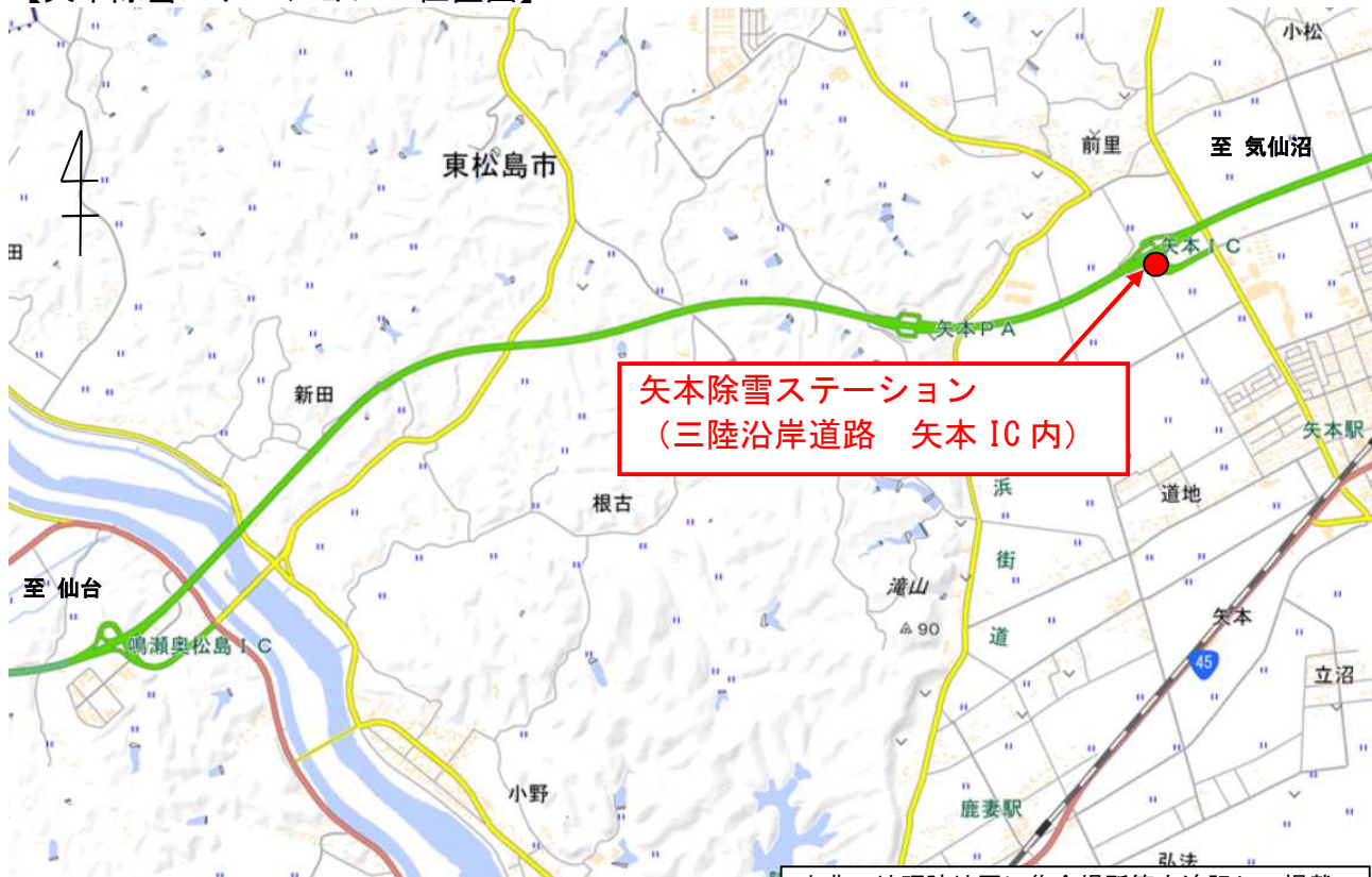
【矢本除雪ステーション 位置図】