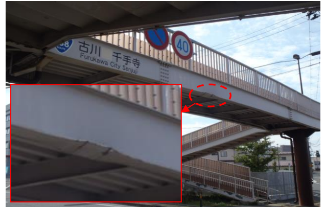
横断歩道橋損傷の例