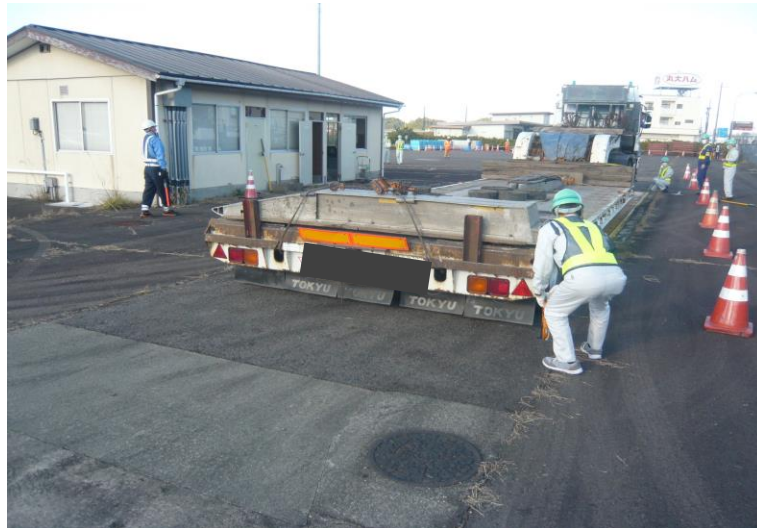
△過去の指導取締りの状況△

※新型コロナウイルス感染症の拡大防止の観点から、可能な限り少人数での取材、マスク着用などに、ご協力をお願いします。