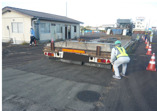
△過去の指導取締りの状況△

※新型コロナウイルス感染症の拡大防止の観点から、可能な限り少人数での取材、マスク着用などに、ご協力をお願いします。