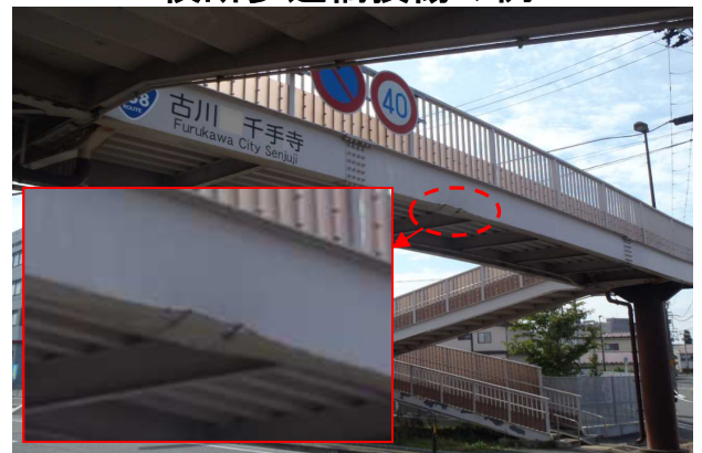
横断歩道橋損傷の例