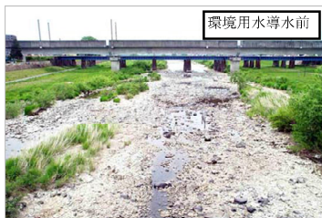
過去の広瀬川の渇水状況

東北農政局阿武隈土地改良調査管理事務所、名取土地改良区 宮城県仙台土木事務所、仙台市