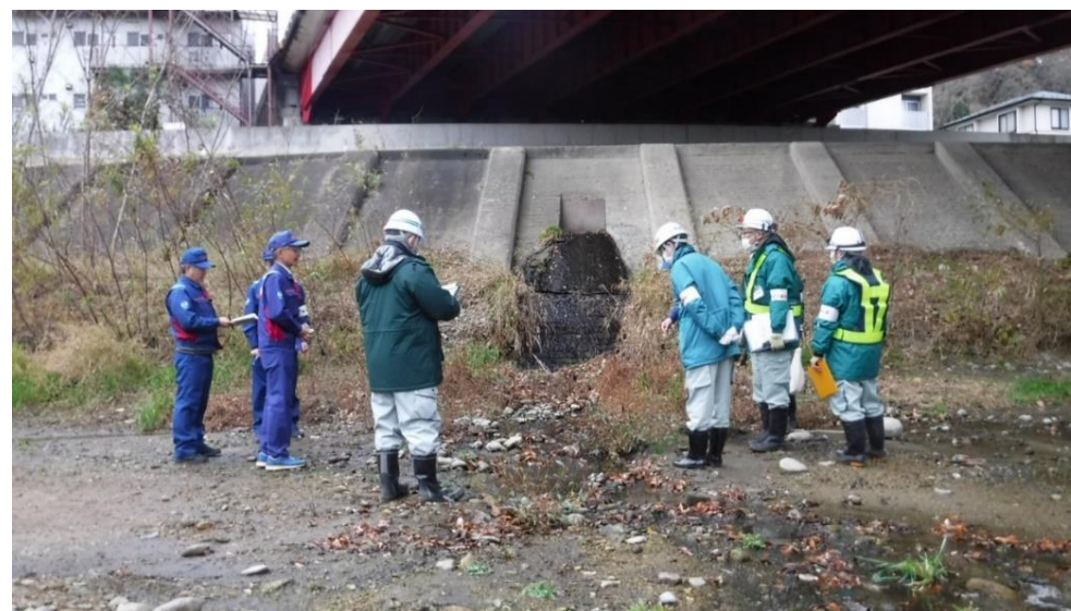
仙台市太白区越路 市雨水管