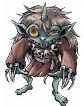
あまのじゃく（岩手）