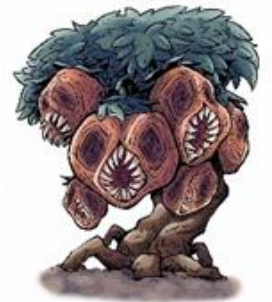
タンタンコロリン（宮城）