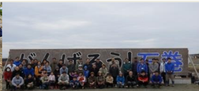
<昨年の活動状況（R1.10月）>

資料配信先:宮城県政記者クラブ・仙台市政記者クラブ・東北電力記者クラブ・石巻記者クラブ・仙南記者クラブ 東北専門記者会・山形市政記者クラブ・福島県政記者クラブ・福島市政記者クラブ