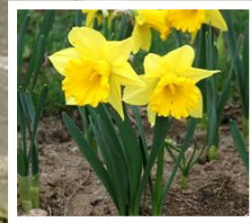
<石巻南浜津波復興祈念公園で開花したスイセン（H30.4月）>