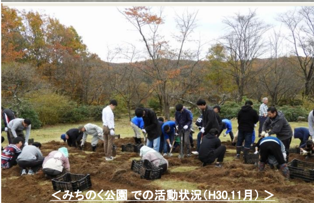
＜みちのく公園での活動状況(H30.11月)＞