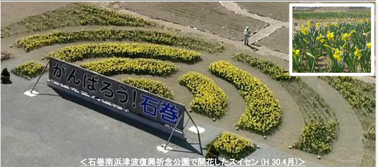
＜石巻南浜津波復興祈念公園で開花したスイセン(H30.4月)＞