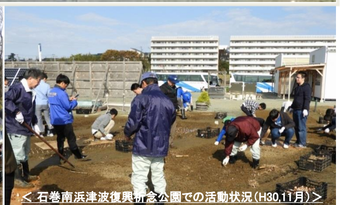
＜石巻南浜津波復興祈念公園での活動状況(H30.11月)＞

ニュースリリース配信先: 宮城県政記者クラブ・仙台市政記者クラブ・東北電力記者クラブ・石巻記者クラブ・仙南記者クラブ 東北専門記者会・山形県政記者クラブ・山形市政記者クラブ・福島県政記者クラブ・福島市政記者クラブ