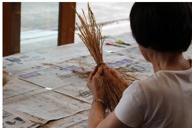
9/23 コキアdeミニホウキ作り

みちのく公園に咲く草花を使った「クラフト体験」や、秋のみちのく公園でしか味わえないイベントを開催します。