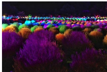
「コキアカリ」会場（昨年）