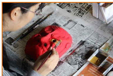
10/12 鬼剣舞のお面絵付け体験