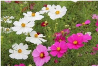
コスモス (センセーション)