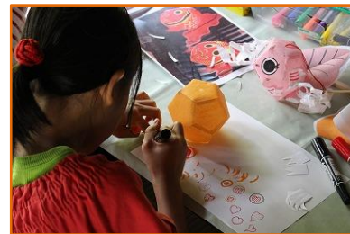
10/14 オリジナル金魚ねぶた作り