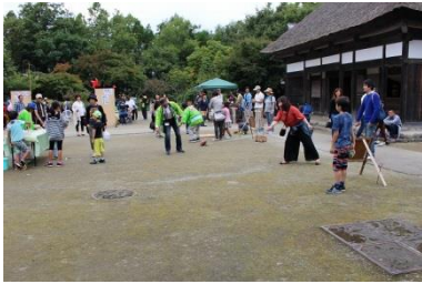
期間中の日曜日 昔遊び体験