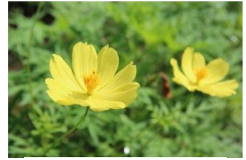
キバナコスモス (レモンブライト)