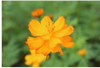
キバナコスモス (ブライトライト)