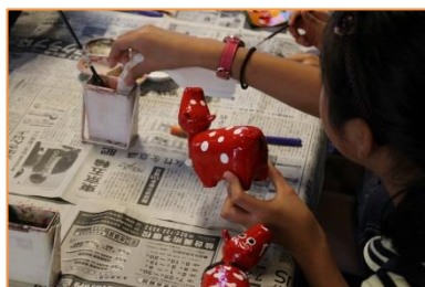
10/14 赤べこ絵付け体験