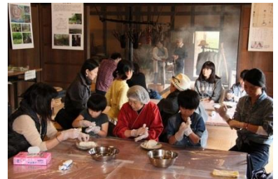
10/12 お月見だんごを作ろう