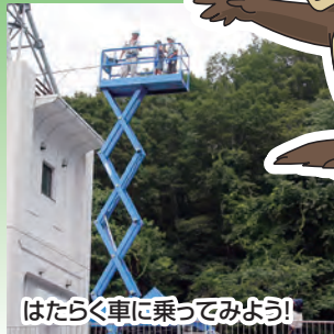
はたらく車に乗ってみよう!