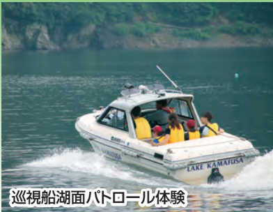
巡視船湖面パトロール体験