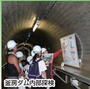
釜房ダム内部探検