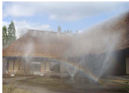
平成 28 年の放水点検の様子(遠野の家)