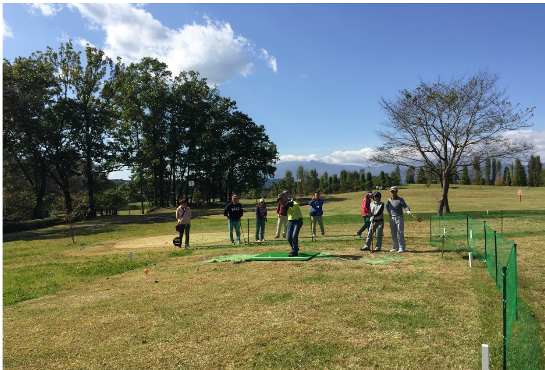
<北地区 風の草原 パークゴルフ場（愛好家による試打）>

資料配信先：宮城県政記者クラブ・東北電力記者クラブ・東北専門記者会・仙南記者クラブ