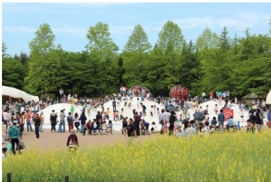
ゴールデンウィークの状況