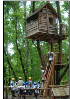
ツリーハウス体験