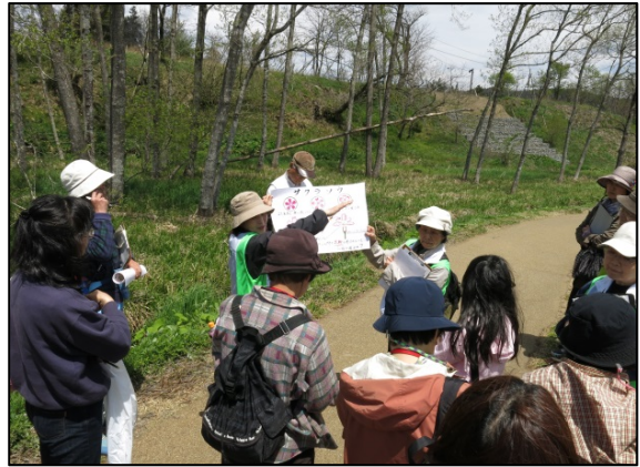
ガイドツアーの様子