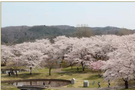
桜の満開の時期（4月中旬）