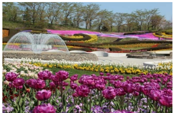
彩りの広場の様子