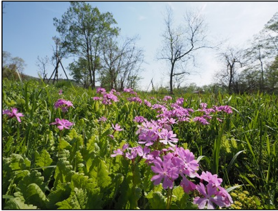
サクラソウの時期（4月上旬）

サクラソウ・オキナグサなどの希少植物が春の見どころとなっている北地区、ガイドツアーも行っています。5/7～5/8は、「自然共生園春まつり」を開催します。