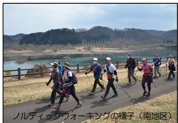
ノルディックウォーキングの様子（南地区）

【ニュースリリース配信先】宮城県政記者クラブ・東北電力記者クラブ・東北専門記者会