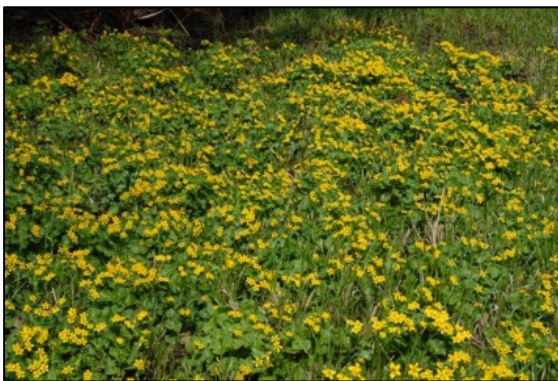
満開のリュウキンカ（4月中旬）

期間中は、「ツリーイング体験会(4/17・5/8)」「森のようちえん in 里山(5/15)」開催。