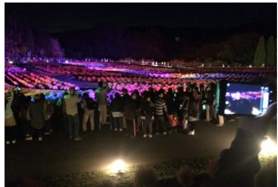
コキアカリの状況（10月）