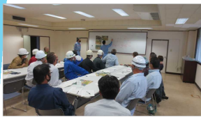
運搬・架設方法打合せ