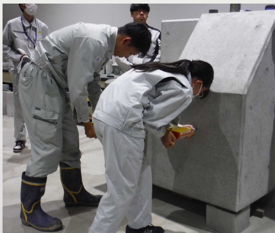
【実習 非破壊試験による品質管理】