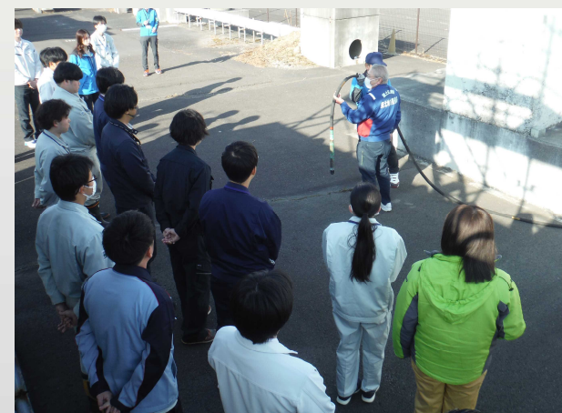
【実習 品質管理：硬化コンクリート】