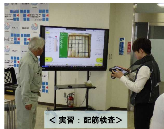
< 実習：配筋検査 >