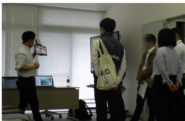
< 実習：AR技術 >