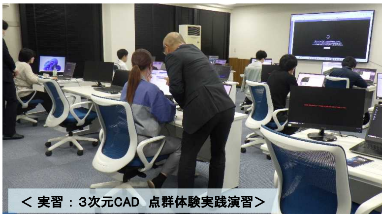
< 実習：3次元CAD 点群体験実践演習 >