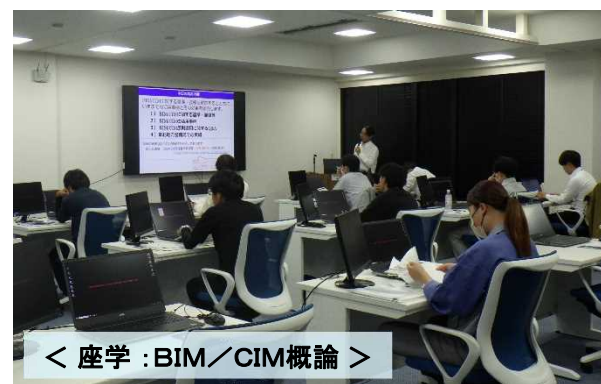
< 座学：BIM/CIM概論 >

DX 東北インフラDX人材育成センターにて開催 担当：総括技術情報管理官（内線301）