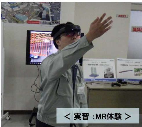
< 実習：MR体験 >