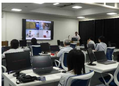
< 座学 : インフラDX概論 >