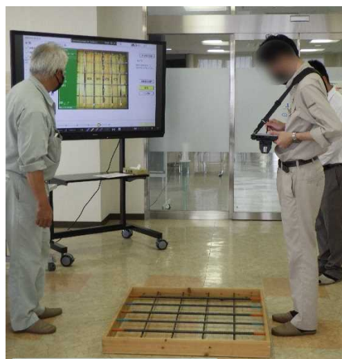
< 実習 : 鉄筋検査 >