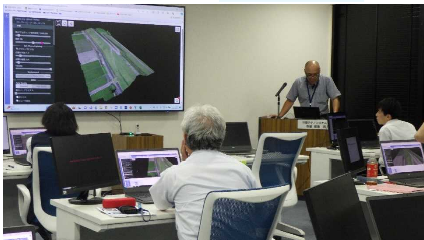
< 実習 : 3次元CAD 点群体験実践演習 >

東北土木技術人材育成協議会では、 官民合同 で 若手技術者の育成 を目的とし、基礎技術講習会を開催しています。