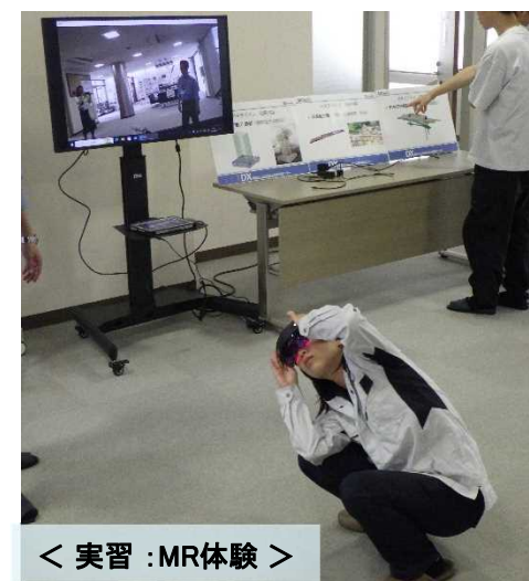
< 実習 : MR体験 >

DX 東北インフラDX人材育成センターにて開催 担当：総括技術情報管理官（内線301）