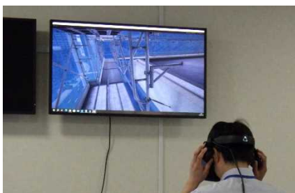
< 実習 : VR体験 >