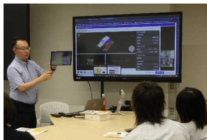
< 実習 : 遠隔臨場 >