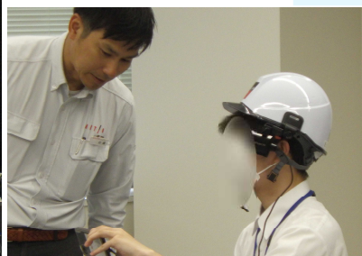
< 実習：遠隔臨場体験 >