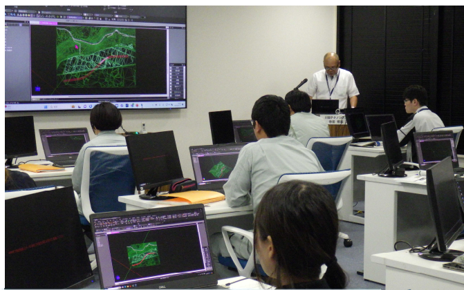
< 実習：3次元CAD 点群体験実践演習 >