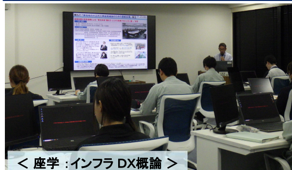
< 座学：インフラDX概論 >