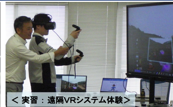
< 実習：遠隔VRシステム体験 >