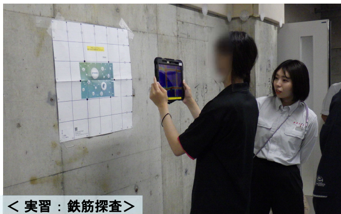
< 実習：鉄筋探査 >

建設分野のDXを学ぶ「 インフラDX 」講習会（年間10回開催）の3回目を開催しました。