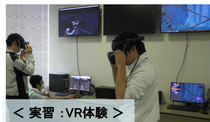
< 実習：VR体験 >