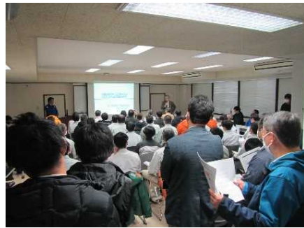
実演前の概要説明

建設用3Dプリンタ技術は、土木・建設分野の効率化・生産性向上への貢献に期待される先端技術であり、実演見学会には大学等の学識者、公共工事発注機関、建設業界の多くの方々が参加し、闊達に質問・意見交換がされていました。