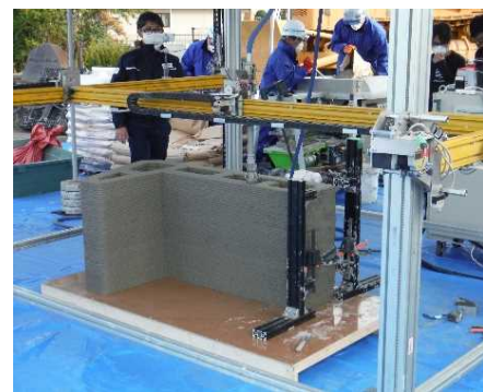
3Dプリンタ製作状況