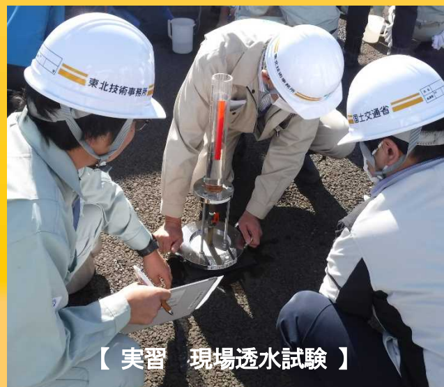
【実習 現場透水試験】