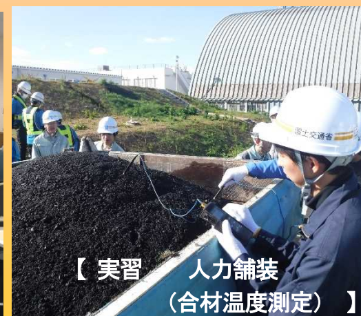
【実習 人力舗装 （合材温度測定）】