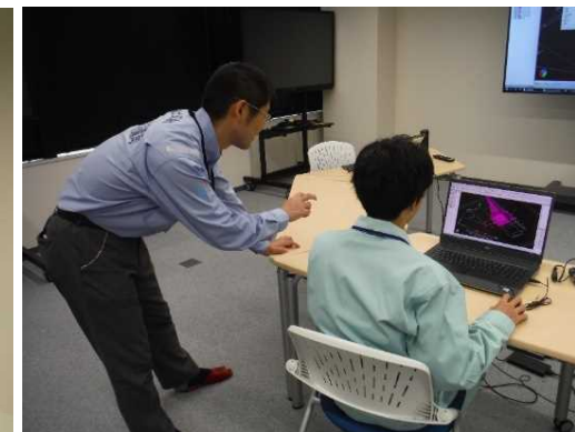
▲ DX技術を体験（3次元点群データ作成）