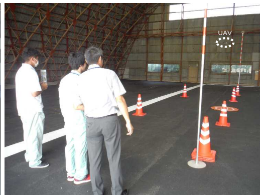
▲ UAVの飛行体験（災害発生時空中撮影）