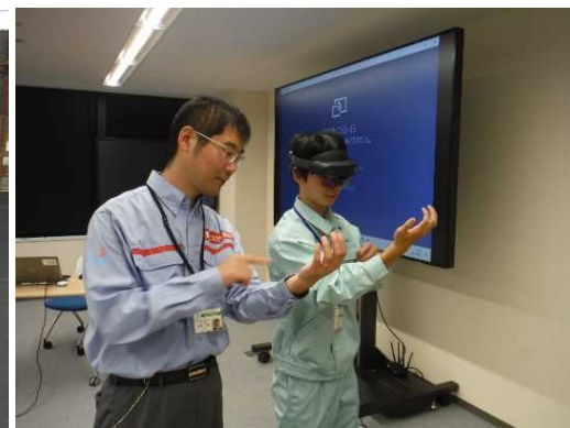
▲ DX技術を体験（MR（複合現実））