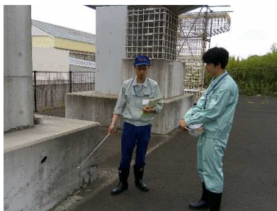
▲ コンクリートの不適切施工・不具合を学習 ※体験型土木構造物実習施設