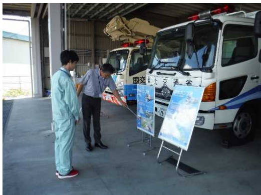
▲ 災害対策用機械について学習