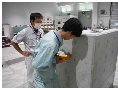
▲ 非破壊試験実習（テストハンマーによる強度推定）