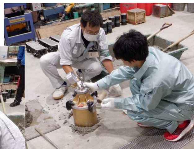
▲ コンクリート材料試験実習（左：スランブ 右：空気量の測定）