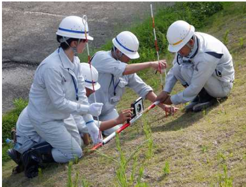
堤防のはらみ出しの計測