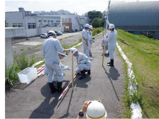
堤防の抜け上がりの計測