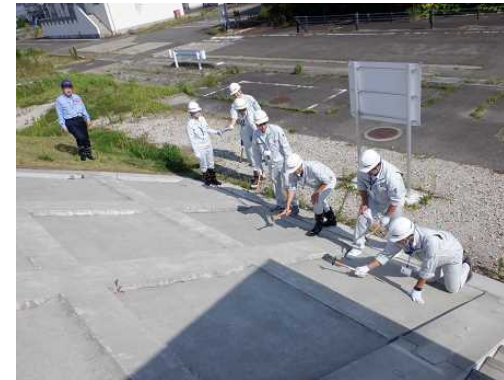
打音による護岸の空洞化の確認