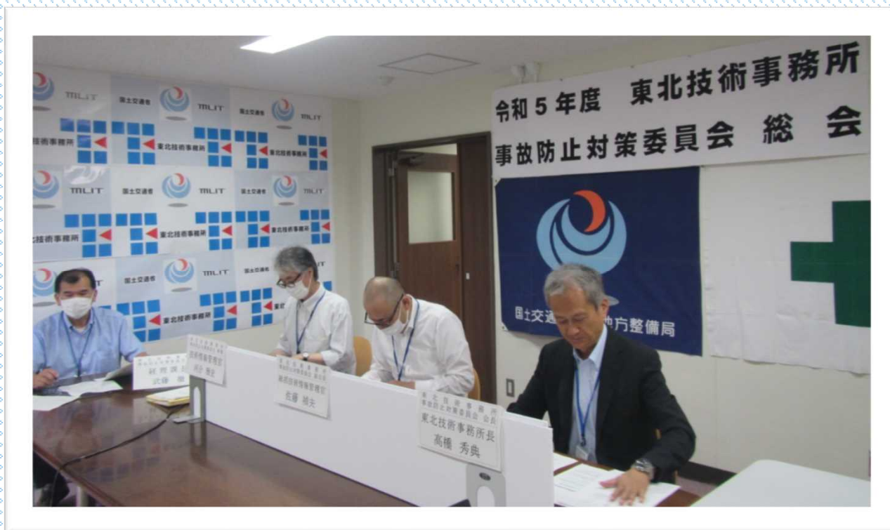
配信会場（発注者側）の様子