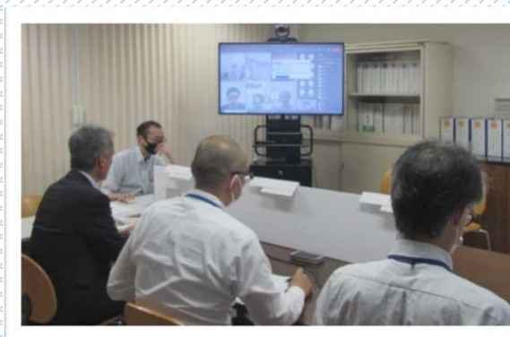
受注者の状況（WEB画面）