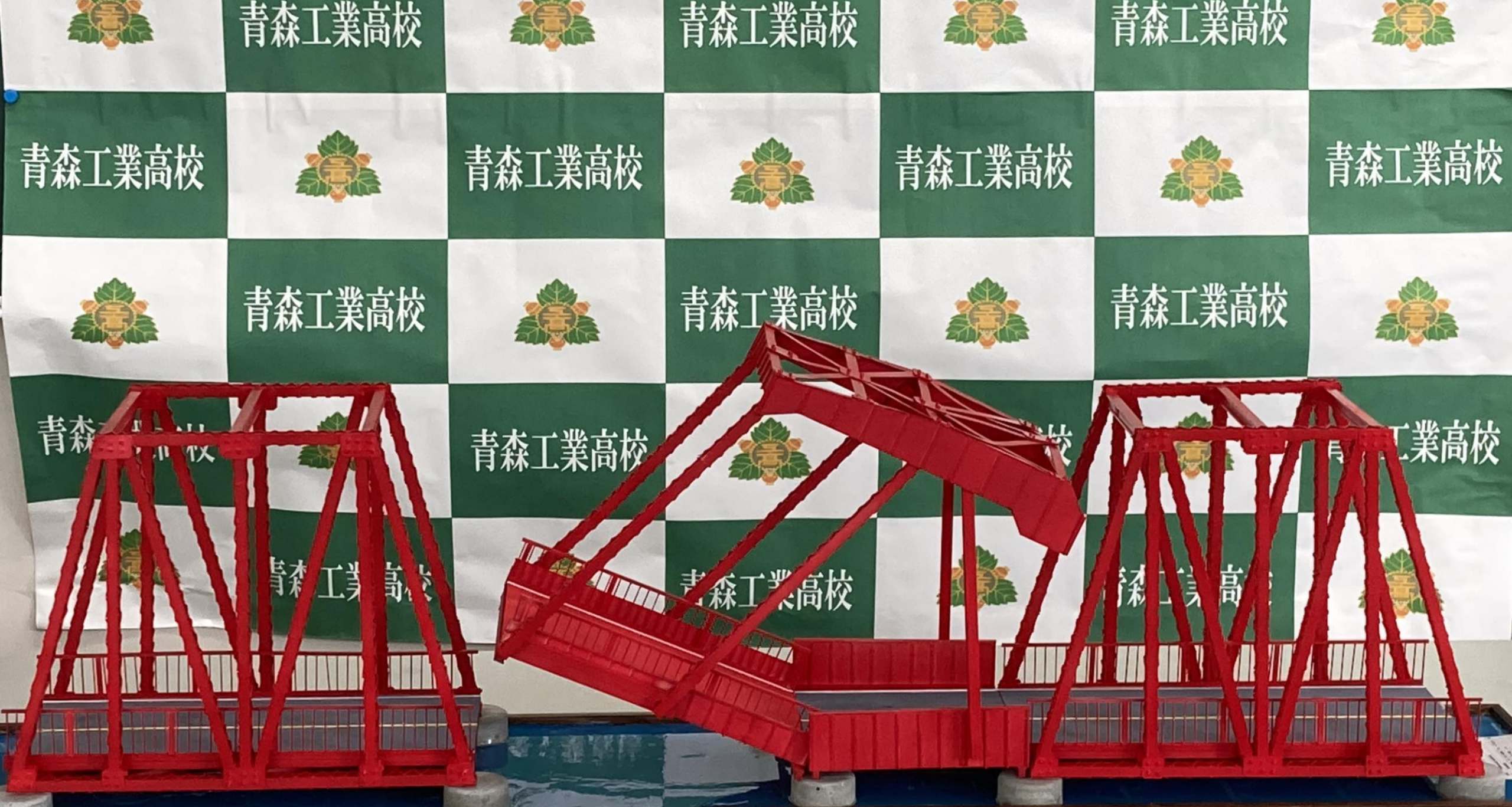
青森県立青森工業高等学校