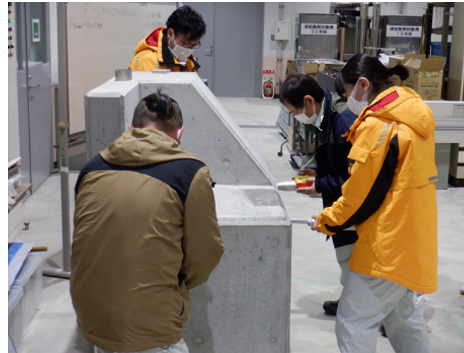
非破壊検査(テストハンマー)体験