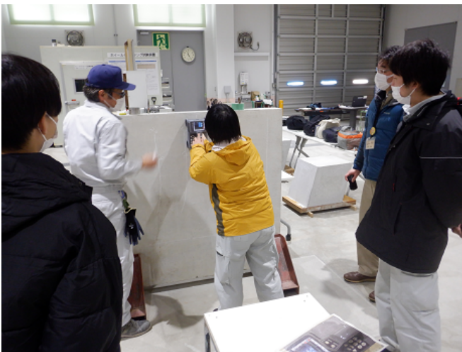
非破壊検査(鉄筋探査)体験