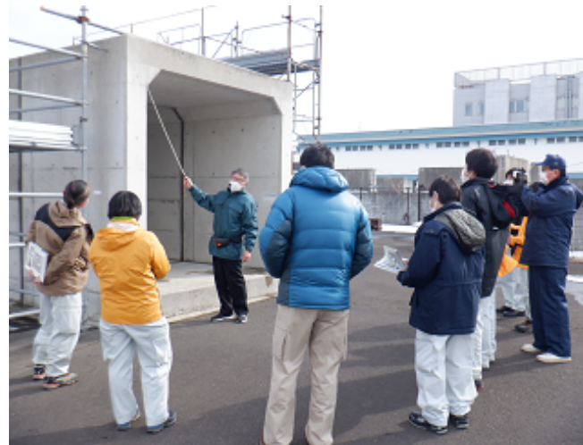
適切な打設について