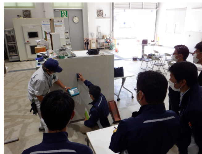
非破壊検査(鉄筋探査)体験