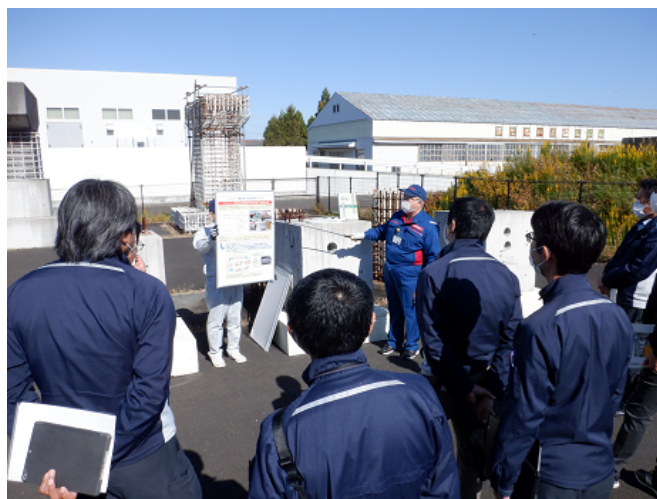
表層品質と耐久性について