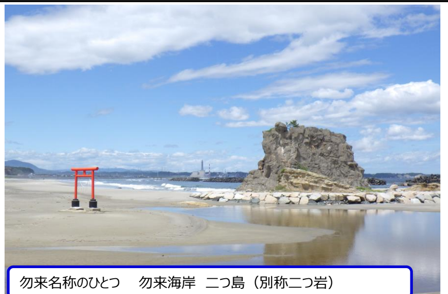
勿来名称のひとつ 勿来海岸 二つ島（別称二つ岩）