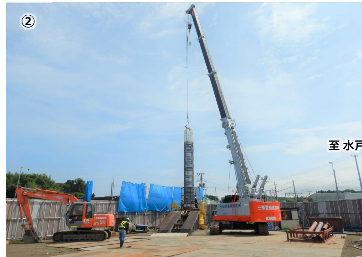
A2橋台杭基礎(杭長8m、杭径1.5m) 施工状況