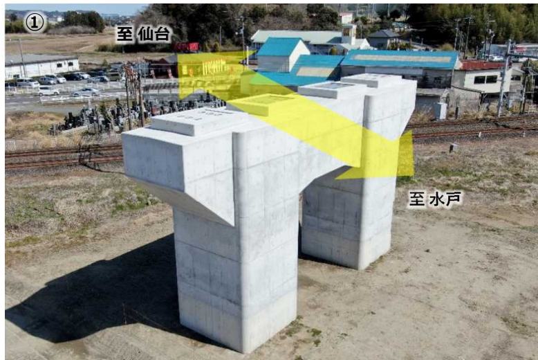
P1橋脚(高さ=11m) 施工完了