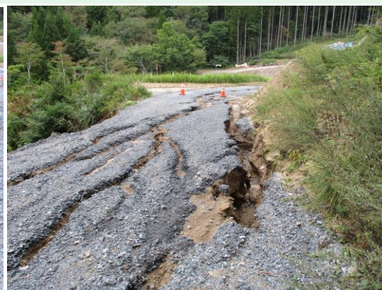
工事用道路の表面を流れた水による侵食