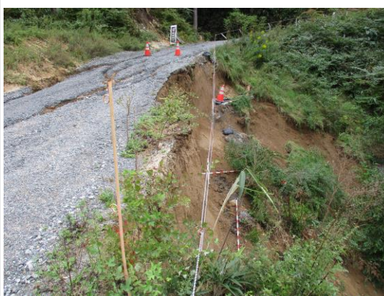
工事用道路の路肩崩落