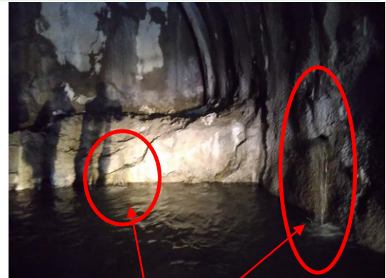
トンネル内で湧水が発生