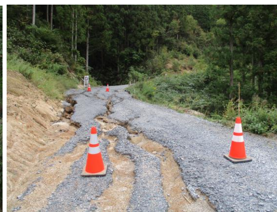
工事用道路の表面を流れた水による侵食