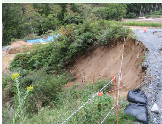
工事用道路の路肩崩落

・いわき市側の工事用道路の被災状況です。路肩崩落や路面の浸食が発生し、一時利用不可能となりました。