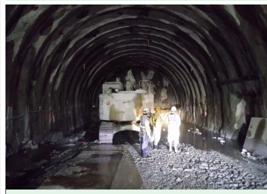
トンネルの切羽(掘削の先端)の水溜り

・土被り(トンネルと地表との距離)が薄くなってきたため、状況により湧水が発生しています。ポンプにより坑外への排水を行っています。詳しい対策についての解説を次回号で行う予定です。