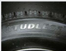
スタッドレス表記の例