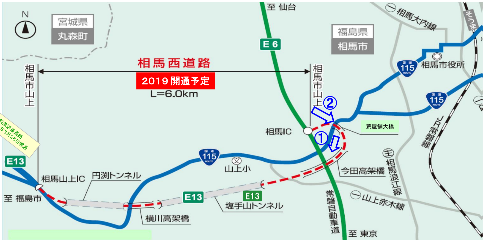
「E13」は高速道路ナンバリングによる路線番号