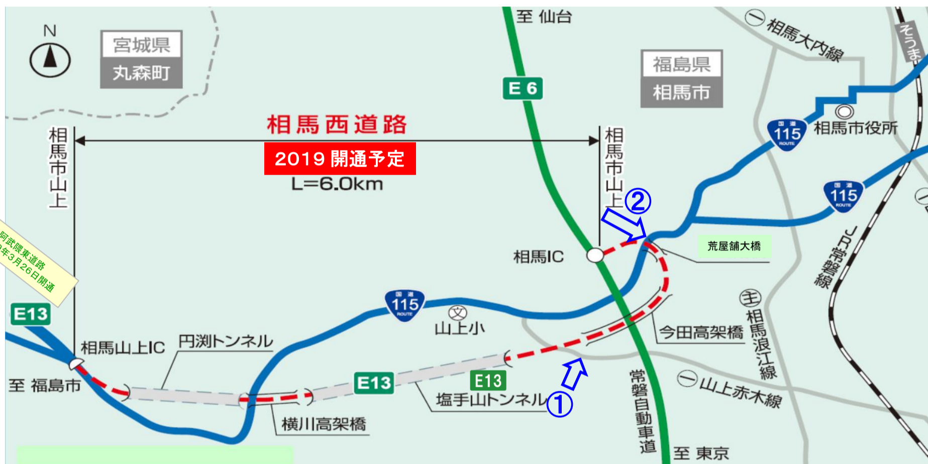
「E13」は高速道路ナンバリングによる路線番号