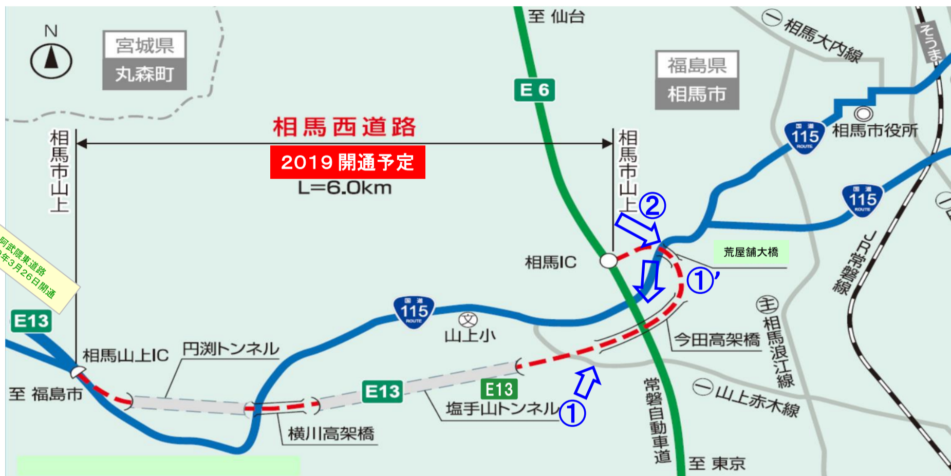
「E13」は高速道路ナンバリングによる路線番号