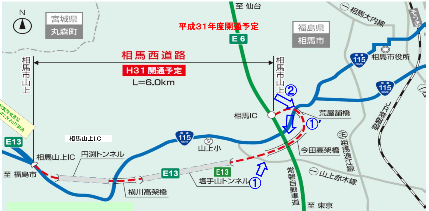
「E13」は高速道路ナンバリングによる路線番号