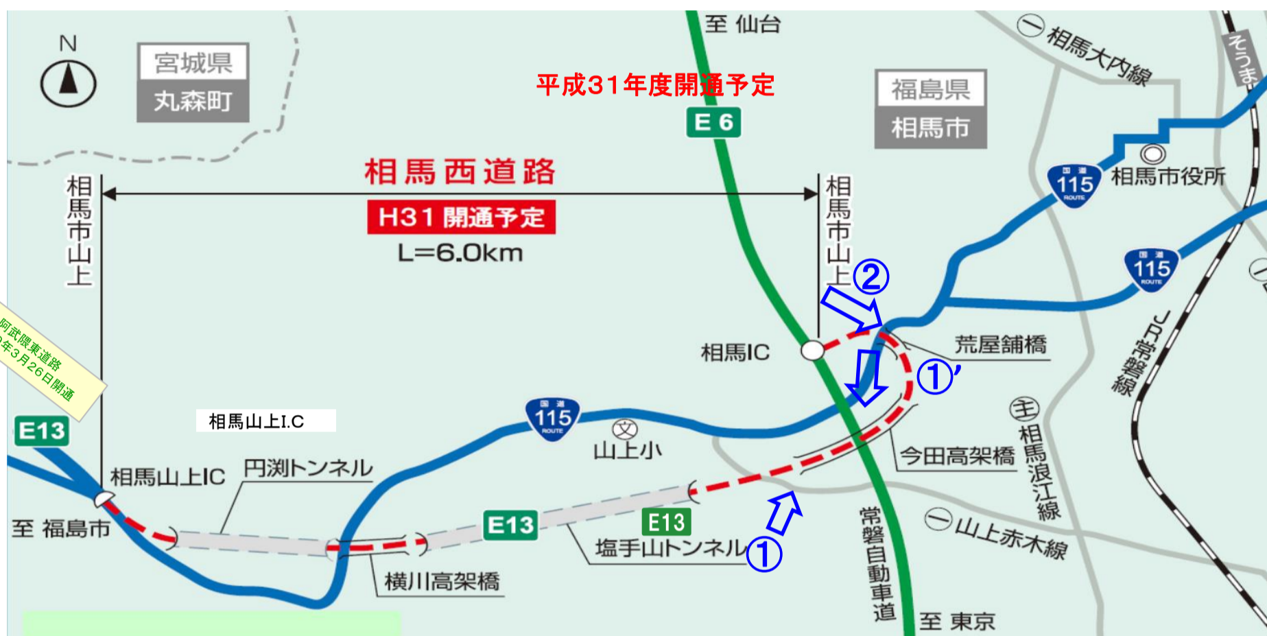
「E13」は高速道路ナンバリングによる路線番号