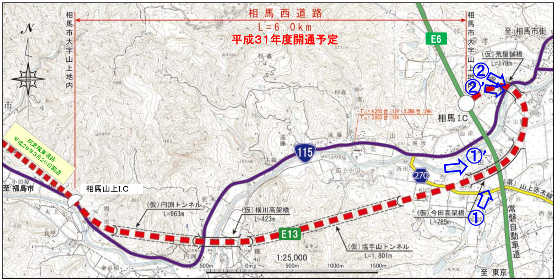
「E13」は高速道路ナンバリングによる路線番号