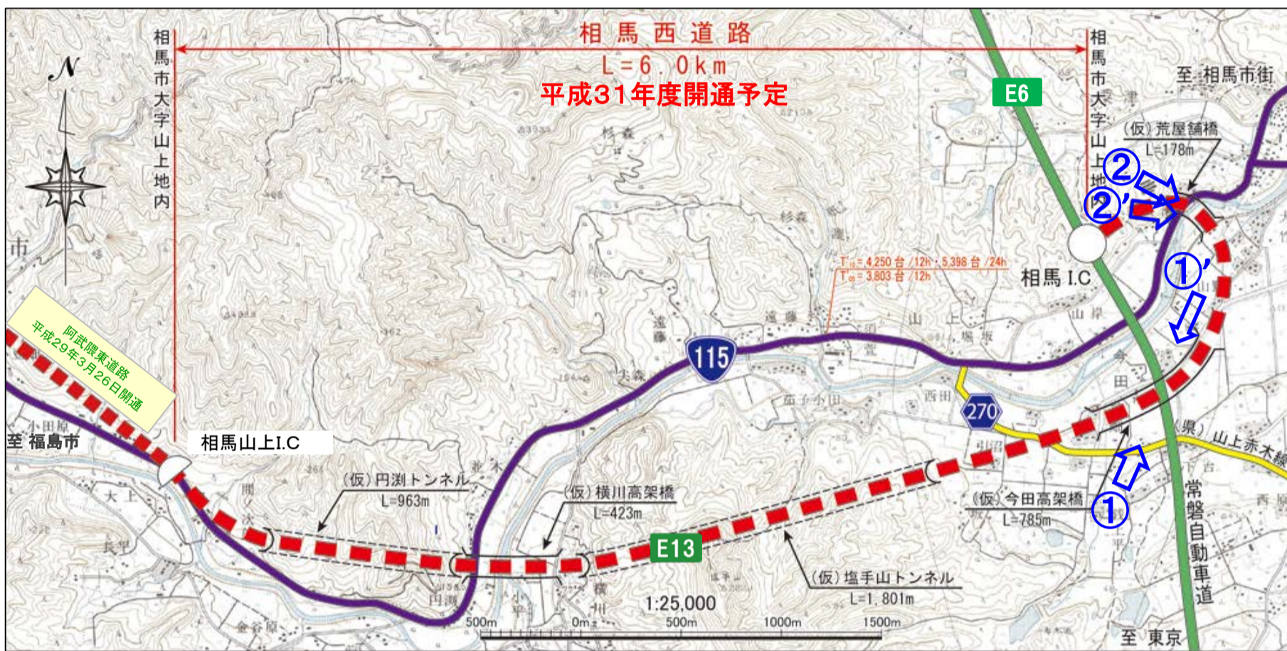
「E13」は高速道路ナンバリングによる路線番号