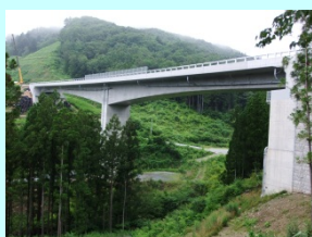
ものくらおおはし 物倉大橋