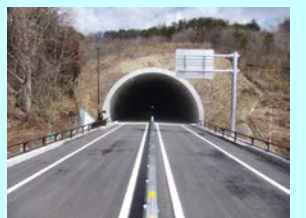
しんたまの 新玉野トンネル