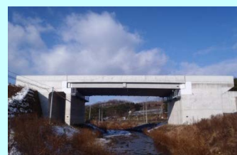
たまのがわはし 玉野川橋