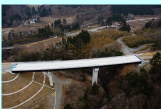
どうきりおおはし 洞切大橋