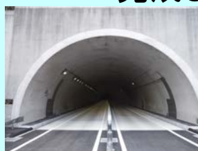
ならばい 榎這トンネル