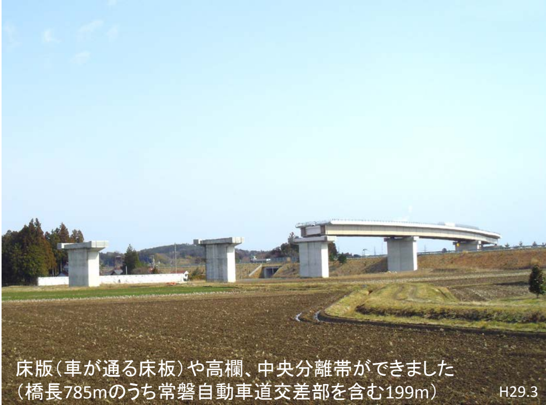
床版(車が通る床板)や高欄、中央分離帯ができました (橋長785mのうち常磐自動車道交差部を含む199m) H29.3