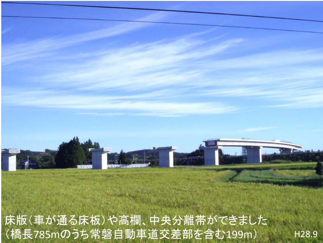
床版(車が通る床板)や高欄、中央分離帯ができました (橋長785mのうち常磐自動車道交差部を含む199m) H28.9