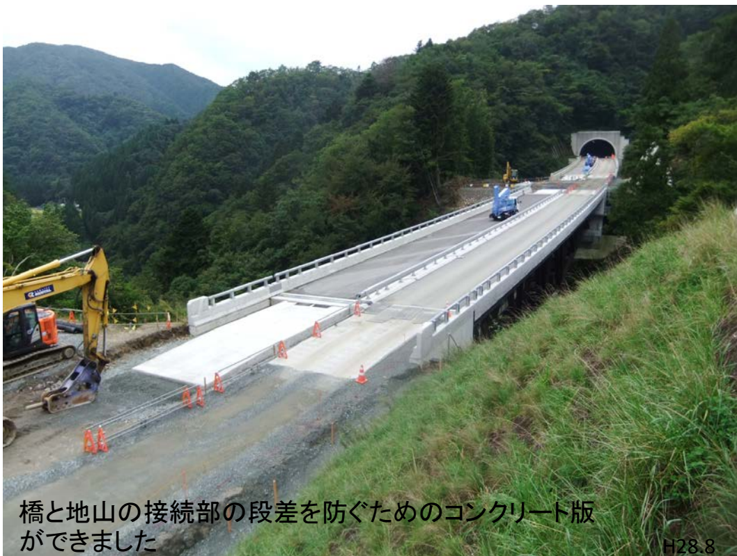
橋と地山の接続部の段差を防ぐためのコンクリート版 ができました H28.8