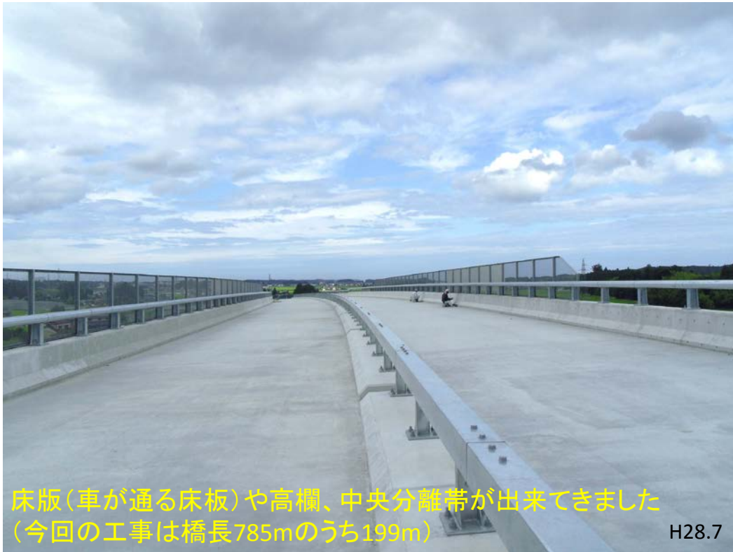
床版(車が通る床板)や高欄、中央分離帯が出来てきました (今回の工事は橋長785mのうち199m)