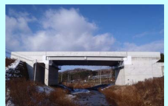
たまのがわばし 玉野川橋