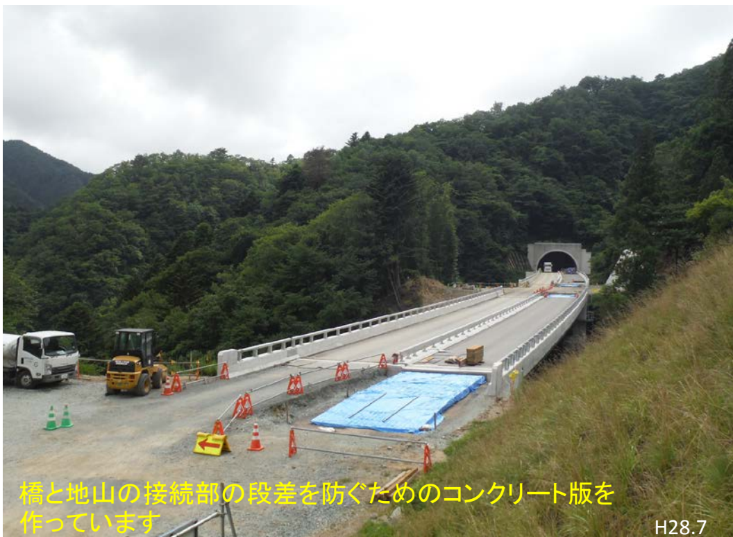
橋と地山の接続部の段差を防ぐためのコンクリート版を作っています