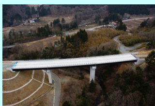
どうきりばし 洞切橋