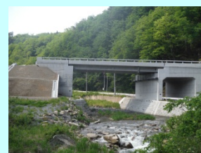
うたがわばし 宇多川橋