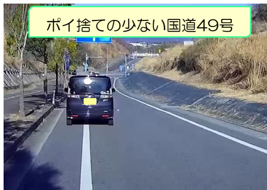
ポイ捨ての少ない国道49号