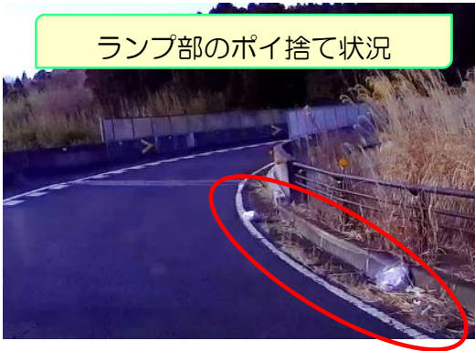
ランプ部のポイ捨て状況