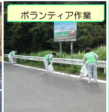
ボランティア作業