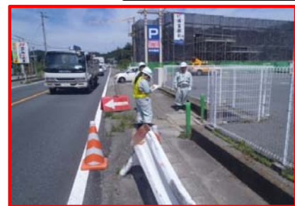
ガードレール破損を確認