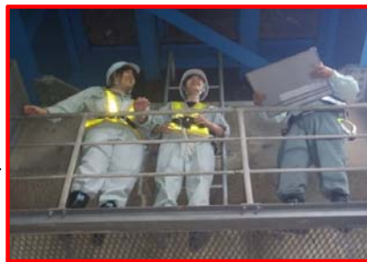
地蔵橋下部工点検