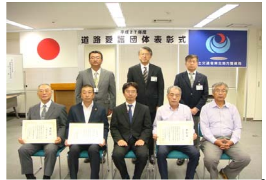
道路功労者表彰・磐城国道事務所長表彰