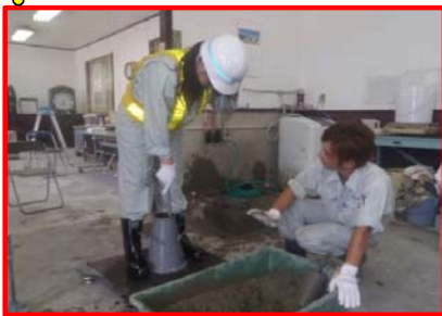
生コン受入れ試験体験