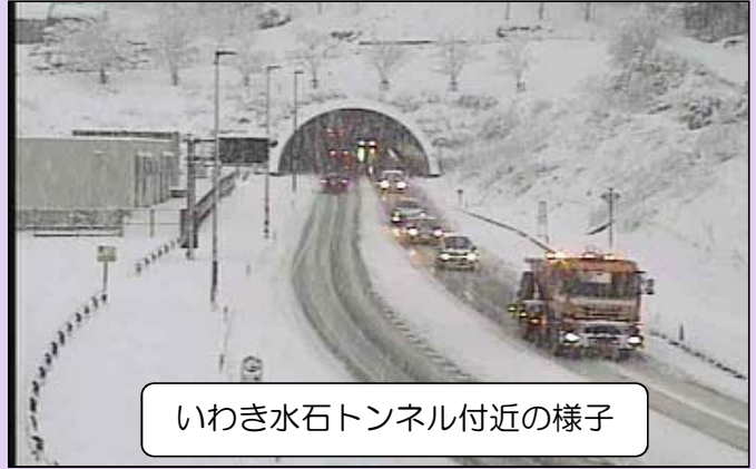
いわき水石トンネル付近の様子