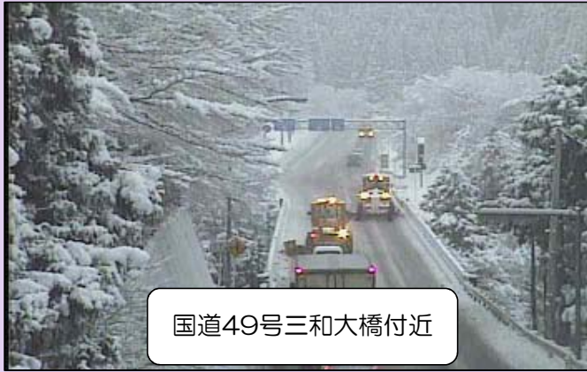
国道49号三和大橋付近

1月の大雪の余韻も残らないうちに、再びいわき市の山間部では大雪に見舞われました。2月5日・18日と南岸低気圧の影響で国道49号では大雪となり、平維持出張所では除雪車や融雪剤散布車をフル稼働させて対応にあたりました。3月になりましたが、まだ山間部では降雪する季節でもありますので、降雪の際は気をつけて安全運転をお願いします。