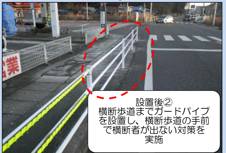
設置後② 横断歩道までガードパイプを設置し、横断歩道の手前で横断者が出ない対策を実施

道路の異状「路肩の崩壊」「路面の汚れ（油・土砂）」「路面の穴ほこ」「故障車・落下物」を発見したら... 道路緊急ダイヤル「#9910」へ 一報をよろしくお願いします。