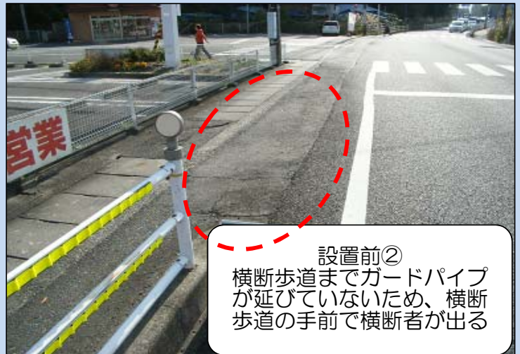
設置前② 横断歩道までガードパイプが伸びていないため、横断歩道の手前で横断者が出る