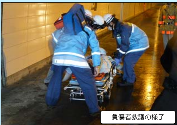
負傷者救護の様子

11月26日、国道49号いわき水石トンネルにおいて防災訓練を行いました。この防災訓練は、トンネル内での車両事故で1名が負傷して車両火災が発生した想定で行われ、非常電話や火災検知器の作動訓練、負傷者救護や消火栓作動訓練や放水作業を実施しました。当日は雨天の中、内郷消防署三和分遣所と合同で約20人ほどが参加し、作業を迅速に対応できるように体制を確認しました。この訓練を受け、トンネル内で万が一事故が発生した場合でも適切に対応していく予定です。