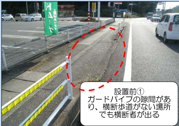
設置前① ガードパイプの隙間があり、横断歩道がない場所でも横断者が出る

昨年11月3日、いわき市常磐湯本町の国道6号において重大事故が発生しました。これを受けて、昨年11月5日にいわき中央警察署・交通安全団体・磐城国道事務所の関係者による合同緊急現場点検を行いました。その中で、横断歩道のない場所にもかかわらず、ガードパイプが途切れている場所があるとの点検結果を受け、乱横断防止対策として、途切れていた場所を埋める交通事故防止対策を行いました。