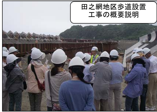
田之網地区歩道設置工事の概要説明

7月15日(月・祝)、いわき市久之浜地区で施工中の「田之網地区歩道設置工事」と「古内橋上部工事」の現場見学会を行いました。 当日は地元の住民の方々約40名ほどに参加いただき、今年度に完成予定の田之網地区歩道設置工事の中で、現在施工中の津波対策として行われている「波返し」擁壁工事の様子と、平成27年度の全線供用を目標に工事を進めている久之浜バイパスの古内橋上部工事の橋桁を架設している様子を見学していただきました。