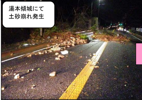
湯本傾城にて土砂崩れ発生