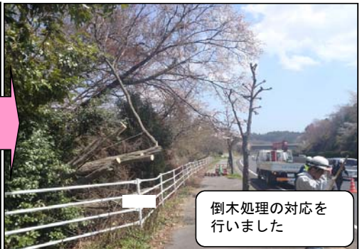
倒木処理の対応を行いました