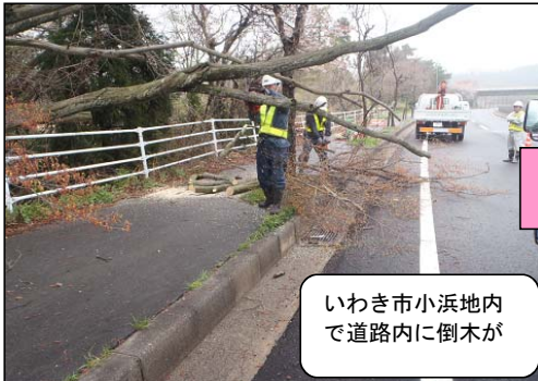
いわき市小浜地内で道路内に倒木が