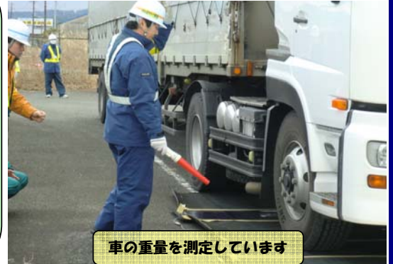
車の重量を測定しています