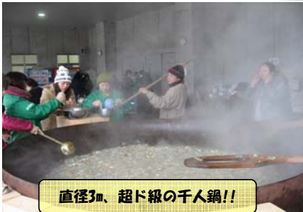
直径3m、超ド級の千人鍋!!