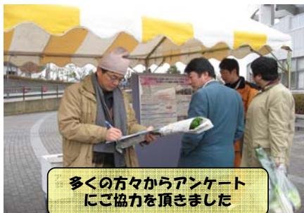
多くの方々からアンケートにご協力を頂きました

1月22日(日)にいわき市南の森スポーツパークで開催された“復興支援事業「がんばろう勿来！千人鍋」”(勿来ひと・まち未来会議 主催)に、磐城国道事務所も参加しました。