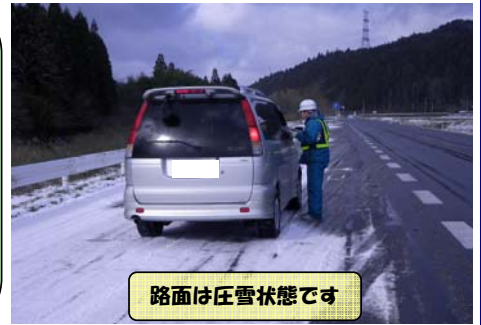
路面は圧雪状態です

昨年12月26日(月)に、国道49号の中寺パーキング(いわき市三和町中寺)で、冬用タイヤ装着キャンペーンを実施しました。当日はいわき中央署と共同で、チラシを配布しながら、冬用タイヤ装着の励行と安全運転の呼びかけを行いました。冬用タイヤの装着率は96%(93台中89台)でした。冬道は気温の変化などで路面状況が急激に変化します。ドライバーの皆さんは、路面状況に注意しながら、速度を抑えて安全運転をお願いします。