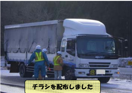
チラシを配布しました