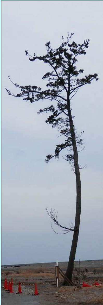
周辺に数万本あった松の保安林が津波で流され、現地には高さ約30mの松が1本だけが残されている。

南相馬市鹿島区南右田地区に東日本大震災の津波から奇跡的に生き延びた『かしまの一本松』があります。原町維持出張所では、国道6号から『かしまの一本松』へのルートがわかりづらいという道路利用者からの声を受け、南相馬市鹿島区役所及び地域住民、現地で保存活動にあたっている「一本松を守る会」と協議を行い、国道6号から一本松までを案内する仮設標識を設置しました。