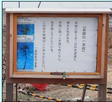
一本松を守る会が設置した説明板