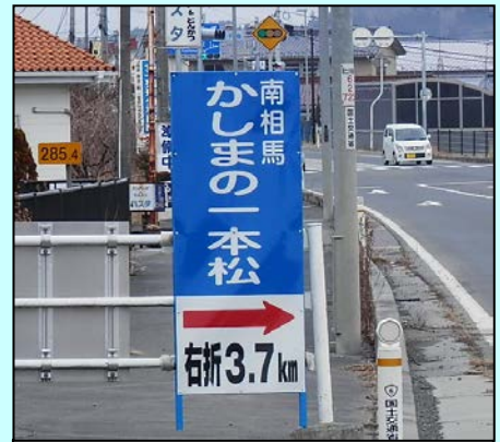
案内標識は方向と距離を示しています